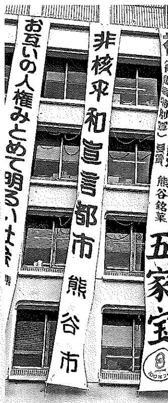
市役所に掲げられた「非核平和宣言都市」の懸垂幕

新型コロナウイルス感染症の影響が長期化しています。また、原油価格や物価の高騰で暮らしが大変になってきていますが、その支援として、水道料金の基本料金を50%減額することになりました。